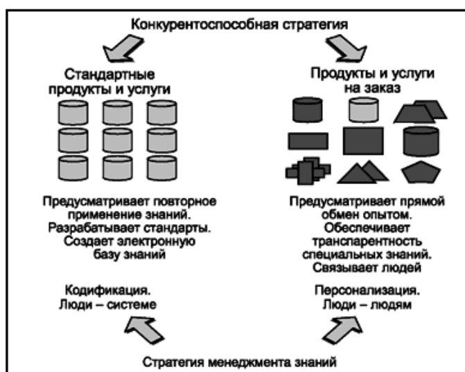
Рисунок 3 - Две общие стратегии МЗ

Эмпирические данные предполагают, что организации начинают работу по внедрению первой инициативы по МЗ в основном в тех областях, которые они рассматривают как свою основную компетентность, таких как маркетинг и продажи, исследования и разработки или производство. В