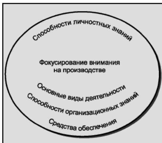
Рисунок 1 - Основа менеджмента знаний: европейская перспектива

На рисунке 1 приведены три наиболее значимых компонента, которые можно выделить в основе СМЗ.