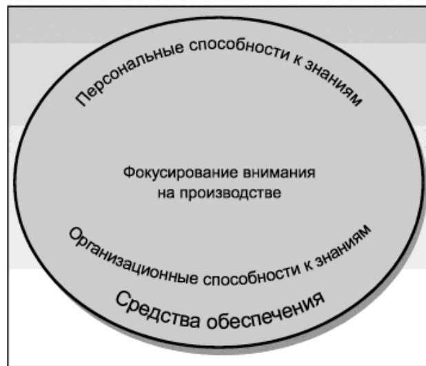
Рисунок 1 - Основа менеджмента знаний

На рисунке 1 приведены три наиболее значимых компонента, которые можно выделить в основе СМЗ: